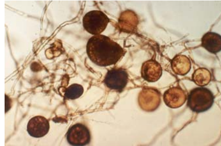
Reinkultur symbiontischer Pilze zur Bodenverbesserung